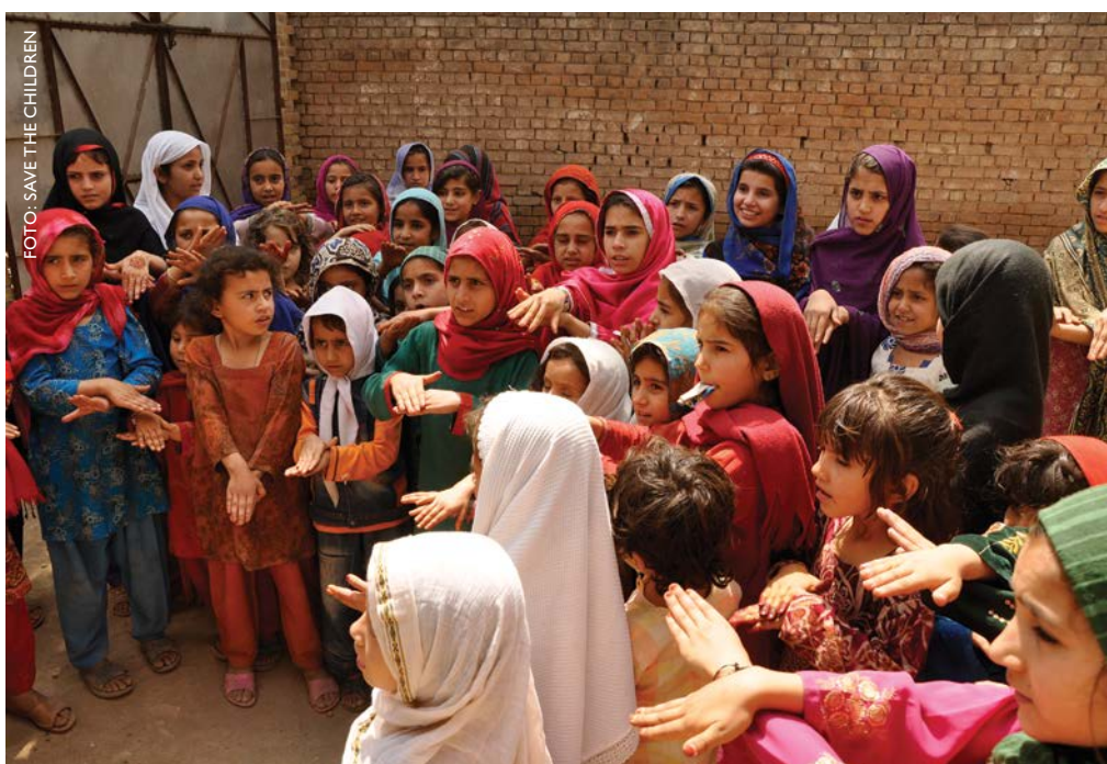
Un grupo de niñas en un centro de aprendizaje temporal para niñas y niños desplazados en el distrito de Peshawar, Pakistán.