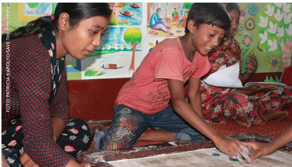
Centro para niñas y niños que trabajan en Khulna, Bangladesh.