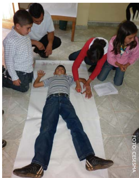
Ejercicio de representación gráfica del cuerpo.