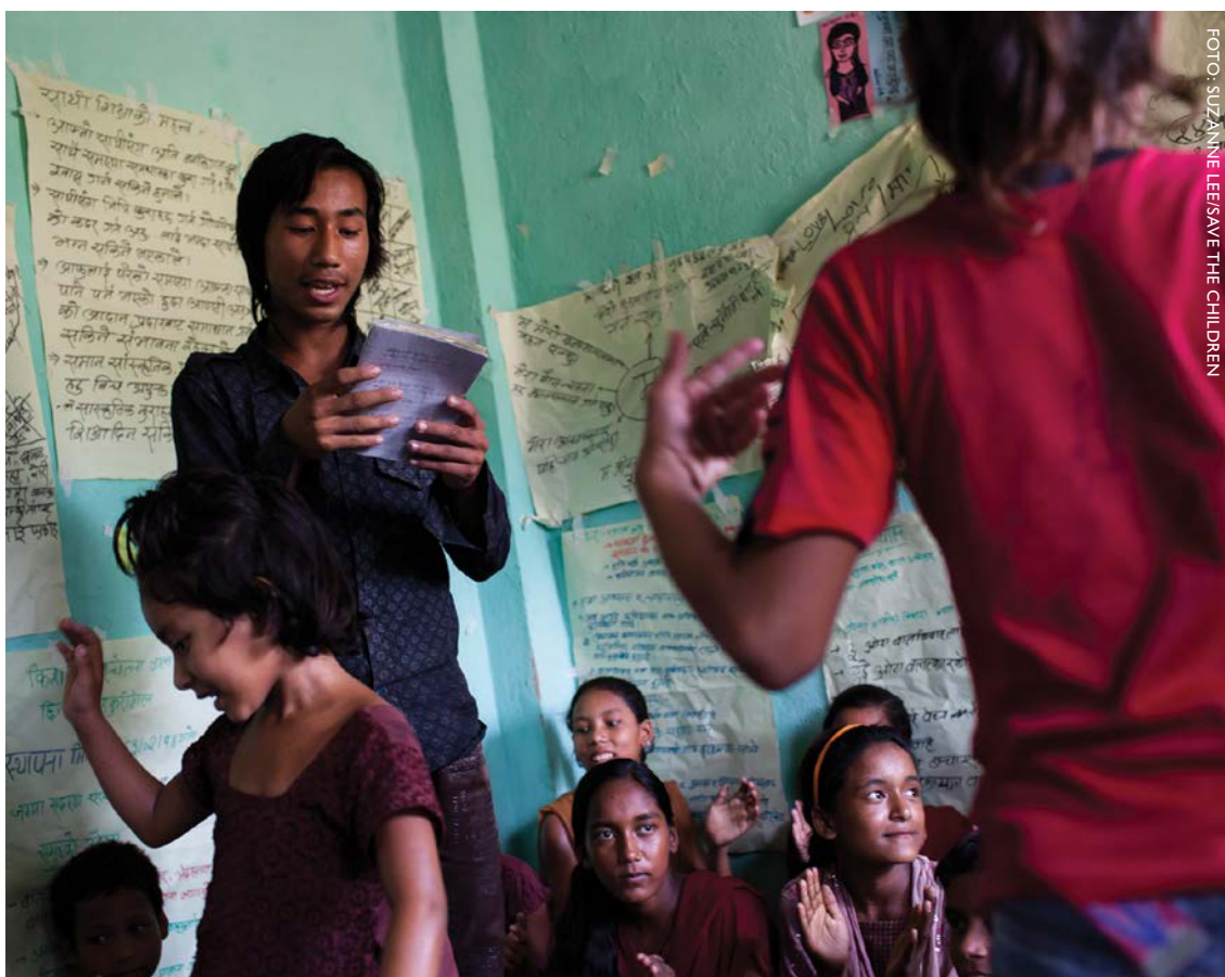
Club de niñas y niños en el distrito de Surkhet, Nepal.

También damos las gracias a The Article 15 Project (Proyecto Artículo 15) por compartir algunas de las viñetas de Article 15 Resource Kit [Conjunto de Recursos de Artículo 15], que puede descargarse de CRCI5.org . Las ilustraciones fueron creadas con la herramienta BitStripsforSchools.com .