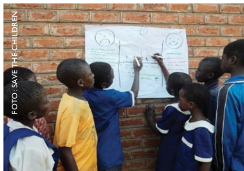
Actividad de evaluación en “H” en Malawi.