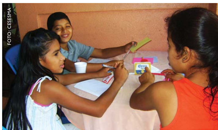
Grupo de discusión de niñas y niños como parte del proceso inicial de un proyecto de monitoreo y evaluación en Waslala, Nicaragua.